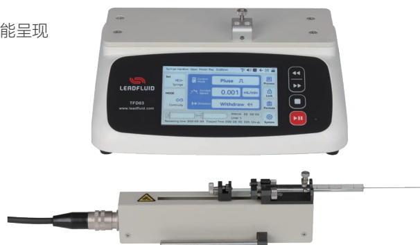
TFD03-01分体注射泵执行单元